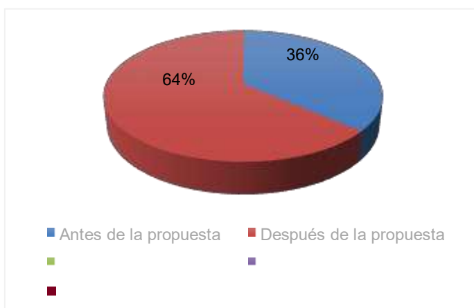
Figura 2. Participación en actividades digitales

Los datos muestran como el nivel de competencias de los estudiantes iniciales era deficiente, ya que estaba sobre el orden de 45%, y ello es reflejo de la falta de habilidades básicas para comunicarse tanto de manera oral como escrita, luego esta lo relacionado con competencias digitales. A través de la observación en el aula, se evidenció un aumento del 30% en la participación estudiantil en comparación con sesiones tradicionales sin herramientas digitales. Los resultados se muestran en el siguiente gráfico: