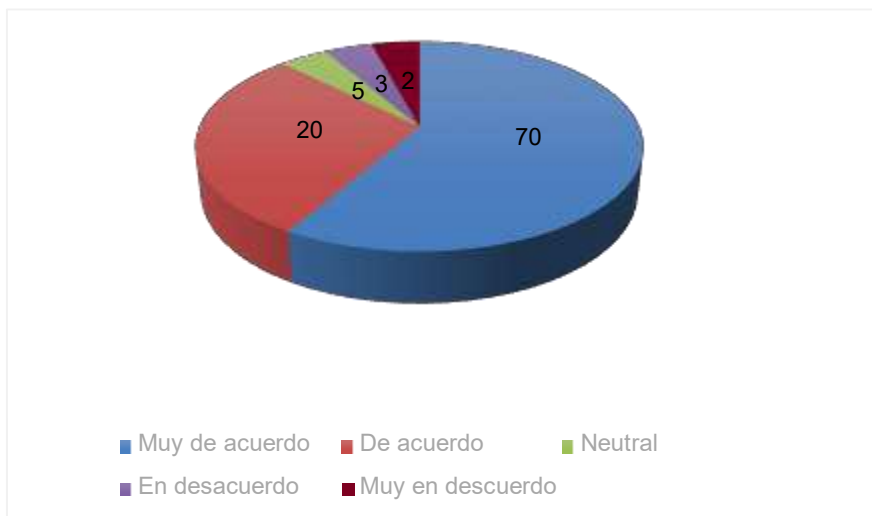
Figura 5. Aprendizaje por medio de las herramientas digitales