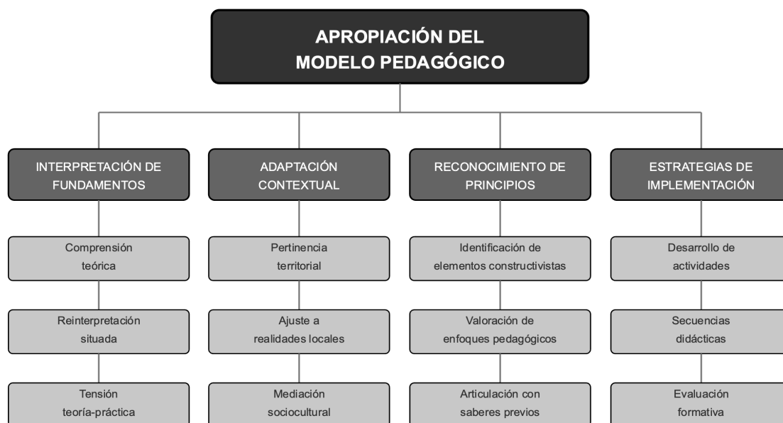
Figura 3. Ilustración de la categoría "Apropiación del modelo pedagógico"

desarrollo teórico en investigación cualitativa, facilitando tanto el proceso analítico como la comunicación de resultados. La red semántica evidencia la complejidad multidimensional de la apropiación del modelo pedagógico, que integra aspectos epistemológicos, contextuales, valorativos y estratégicos en una estructura de significados interconectados que configura la experiencia docente con el constructivismo en el contexto rural de la IESI Piendamó.